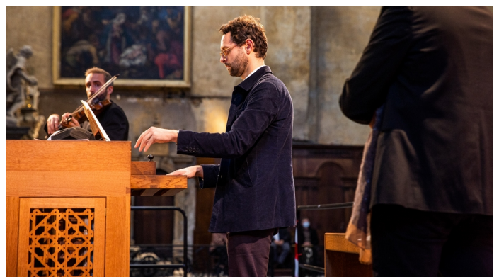
@ Alexandre Ollier