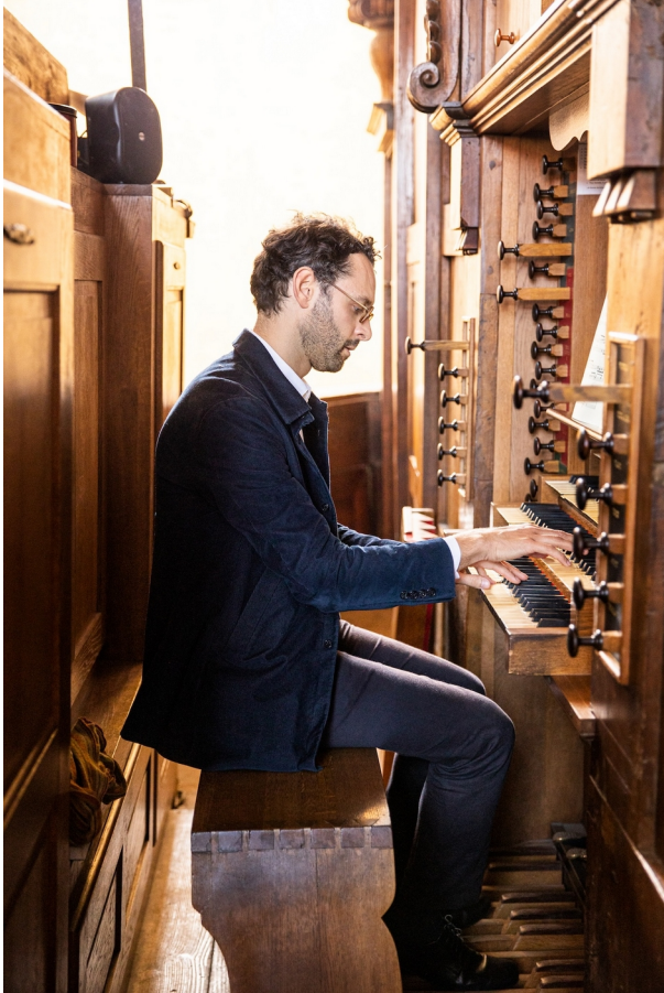
@ Alexandre Ollier